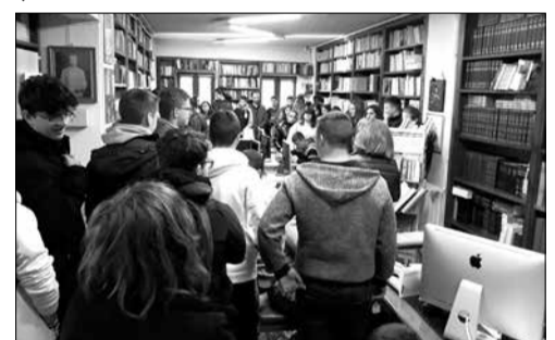
Από την επίσκεψη του Γυμνασίου Μεγαλόπολης

Όλοι γνωρίζουμε ότι η Βιβλιοθήκη της Βυτίνας αποτελεί το σημαντικότερο πνευματικό ίδρυμα του τόπου μας, η οποία αριθμεί διακόσια δέκα και πλέον χρόνια ζωής και είναι από τα ιστορικότερα ιδρύματα. Οι δραστηριότητες της ενισχύουν την πνευματική ζωή της Βυτίνας και βοηθούν το επιστημονικό έργο των σχολείων προσφέροντας στους μαθητές το πολύτιμο ιστορικό υλικό που διαθέτει. Το περασμένο εξάμηνο πραγματοποιήσε αξιόλογο έργο δεχόμενη επισκέψεις μαθητών και οργανώνοντας εκδηλώσεις, που έχουν στόχο να υλοποιήσουν το πρόγραμμα της. Έτσι με την ευκαιρία της ημέρας του παιδικού βιβλίου οργάνωσε έκθεση παιδικών βιβλίων και δέχθηκε επισκέψεις σχολείων.