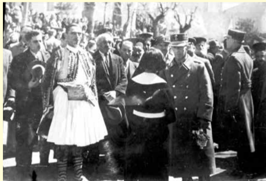
1938 ο τότε πρόεδρος της κοινότητας Επαμ. Πανταζόπουλος με εθνική ενδυμασία υποδέχεται στη Βυτίνα τον βασιλιά Γεώργιο Β'

χημένος από όλους, ο οποίος εκλέγεται το 1877, 1882, 1886, 1890, 1895, 1900, 1903, 1910.