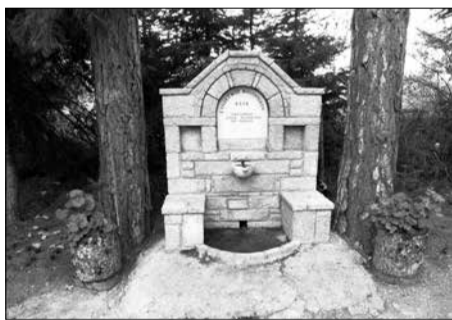
Μία από τις θαυμάσιες βρύσες, έργο του συνδέσμου φιλοπροόδων

ξιο της φήμης του. Μέχρι τη στιγμή που γράφονται οι γραμμές αυτές και από όσα είμαστε σε θέση να γνωρίζουμε έχει ολοκληρωθεί ο καθαρισμός, έχει συντηρηθεί και τεθεί σε λειτουργία το σιντριβάνι, έχουν φυτευτεί νέα δένδρα, έχουν τοποθετηθεί καλάθια απορριμμάτων, ενώ ολοκληρώθηκε η κατασκευή τρι-