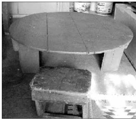
Τραπεζάκι (σοφράς) για το πλάσιμο

σπιτιού πριν «στερφέψουν». Οι αναλογίες διέφεραν από σπίτι σε σπίτι και από νοικοκυρά σε νοικοκυρά. Το «ζύμωμα» γινόταν την παραμονή της παρασκευής από χειροδύναμες γυναίκες, διότι το «ζυμάρι» ήταν πολύ «βαρύ» και έπρεπε να δουλευτεί καλά. Όλη τη νύχτα «ωρίμαζε» και το πρωί, πολύ πρωί, άρχιζε το άνοιγμα των φύλλων σε χαμηλά τραπεζάκια (σοφράδες) από έμπειρες ηλικιωμένες «πλάστρες».