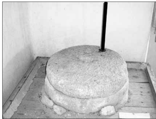
Χερόμυλος για το «μπλιγούρι»

Το κάθε φύλλο, για να «ανοικτεί», χρειαζόταν, όσο έμπειρη και αν ήταν η «πλάστρα», περίπου ένα τέταρτο. Κατόπιν απλωνόταν, για να στεγνώσει, στο μεγάλο δωμάτιο, τη «σάλα», πάνω σε καθαρά σεντόνια. Όταν στέγνωνε, το μάζευαν με τον «πλάστη» και άρχιζε το κόψιμο κάθετα και οριζόντια έως ότου κατέληγαν στα μικρά τετράγωνα κομματάκια, που όλοι ξέρουμε, και το σχήμα αυτό διατηρείται μέχρι σήμερα και στο βιομηχανοποιημένο προϊόν. Οι πεπειραμένες «κόφτρες» έκοβαν