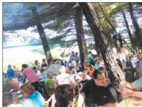
Οι συνδαιτημένες και ο χορός

Ε δώ και χρόνια ο σύνδεσμος Φιλοπροόδων έχει καθιερώσει να πραγματοποιεί στις 26 Ιουλίου, εορτή της Αγίας Παρασκευής, το ετήσιο πανηγύρι του, που αποκτά «Παμβυτινιώτικο» χαρακτήρα αλλά και πρόσκληση για προσέλευση προς τους κατοίκους των γύρω χωριών. Η καθιέρωση της εκδήλωσης δεν έγινε τυχαία αλλά είναι το αποτέλεσμα μιας σειράς διαδικασιών με κορυφαία τον εξωραϊσμό και την αξιοποίηση του χώρου ενός από τους πιο ειδυλλιακούς της Βυτίνας, όπως ο λόφος της Αγίας Παρασκευής στα «Λακώματα».