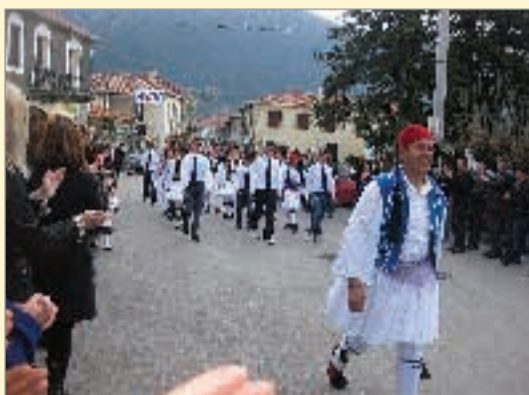
Η παρέλαση του Γυμνασίου και του Λυκείου