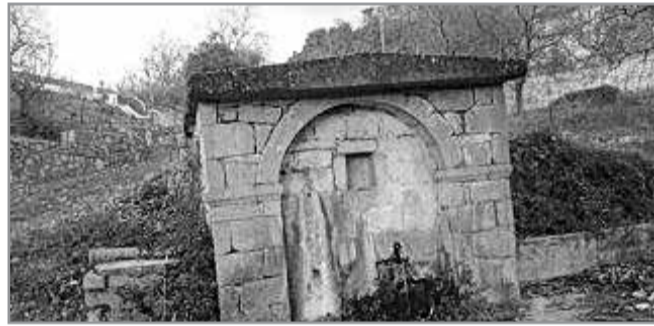
Το «κακούτσι» πλησίον του οποίου κατέφυγαν ο Β. και η Θ. μετά την εκούσια απαγωγή τους.

Τα «σκάνδαλα» των απαγωγών συνεχίστηκαν και κατά την εποχή του λεγόμενου εμφυλίου πολέμου.