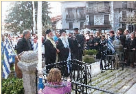
Το «τρिसάγιο» και η κατάθεση στεφάνων

Στη συνέχεια ακολούθησαν στο άκρον της πλατείας εθνικοί χοροί από τους μαθητές, οποιούς είχαν επιμεληθεί οι καθηγητές φυσικής αγωγής. Χορούς κατά σειρά απέδωσαν όλα τα σχολεία κύρια τοπικού αλλά και ευρύτερου πανελληνίου φάσματος. Χάρμα οφθαλμών το θέαμα. Οι νέοι γνωρίζουν πολύ καλά την εθνική μας παράδοση, μπορεί και καλύτερα από τους παλαιότερους, και την αποδίδουν ανάλογα. Παρατηρώντας τον τρόπο που χόρευαν όλοι οι μαθητές (ντόπιοι και αλλοδαποί) δεν μπορούσε κανείς να ξεχωρίσει ποιος χόρευε καλύτερα και θυμάται τα χαρακτηριστικά λόγια του Ισοκράτη στον «Πανηγυρικό» του: « Τοσούτον δε απολέλοιπεν η πόλις ημών περί το φρονείν και λέγειν τους άλλους ανθρώπους, ώσθα οι ταύτης μαθηταί των άλλων διδάσκαλοι γεγόνασιν, και το των Ελλήνων όνομα πεποιήκε μηκέτι του γένους αλλά της διανοίας δοκείν είναι, και μάλλον Έλληνας καλείσθαι τους της παιδείσεως της ημετέρας ή τους της κοινής