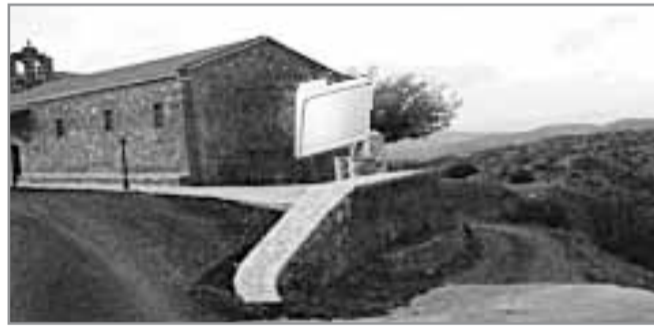
Η εκκλησία των Αγίων Αποστόλων στην οποία τελέστηκαν αρκετοί γάμοι των εκουσίως αλληλοσπαχθέντων