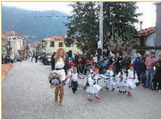
Η παρέλαση του νηπιαγωγείου και του δημοτικού