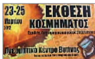
Η αφίσα της εκδήλωσης

Να ευχηθούμε επιτυχή και παραγωγική πορεία στο μοναδικό πανελλαδικό εκπαιδευτικό ίδρυμα της Στεμνίτσας και να μας δίνει διαρκώς την χαρά να «γευόμαστε» τέτοιες εκπληκτικές δημιουργίες των σπουδαστών της.