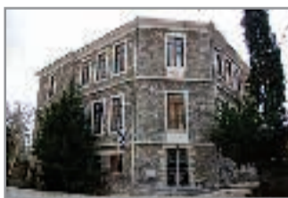
Το κτίριο της σημερινής σχολής που στέγαζε και την παλαιά παραδοσιακή σχολή αργυροχρυσοχοΐας

Μεγάλη επιτυχία σημείωσε η έκθεση κοσμημάτων της σχολής αργυροχρυσοχοΐας της Στεμνίτσας, που πραγματοποιήθηκε στην Βυτίνα από 23 έως 25 Μαρτίου. Η εκδήλωση στεγάστηκε στο Πανταζοπούλειο πνευματικό κέντρο. Ξεκίνησε την Παρασκευή 23 Μάρτη και ολοκληρώθηκε την Κυριακή 25 Μάρτη. Το τριήμερο αυτό το χώρο επισκέφτηκαν πολλοί ντόπιοι αλλά και επισκέπτες της Βυτίνας όπως επίσης αρκετοί σπουδαστές συγγενών ειδικοτήτων, που έφτασαν εδώ για το λόγο αυτό.