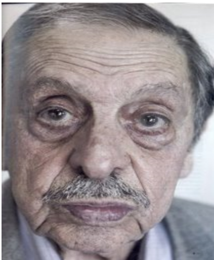
Ο Απόστολος Σάντας

30 Μαΐου 1941. Οι κατακτητές έχουν επιβάλλει την κυριαρχία τους. Η αντίσταση στη Κρήτη «πνέει τα λούσθια» και οι Έλληνες προσπαθούν να οργανωθούν και να αντιμετωπίσουν τις νέες συνθήκες. Σκέψη για αντίσταση δεν έχει διαμορφωθεί ακόμα. Ο Γερμανός κατακτητής αγέρωχος προσπαθεί να κάνει όσο γίνεται εντονότερη την παρουσία του. Και διαλέγει τον πιο ιερό χώρο της Ελληνικής ιστορίας, το βράχο της Ακρόπολης, να σηκώσει την πολεμική του σημαία, σύμβολο κυριαρχίας και υποδούλωσης. Δυο νεαροί φοιτητές ο Βυτιναίος Απόστολος Σάντας και ο Ναξιώτης Μανώλης Γλέζος αποφασίζουν μια παράτολμη ενέργεια. Να κατεβάσουν από τον ιστό το σύμβολο της δουλείας εξευτελίζοντας έτσι τον Γερμανό εισβολέα. Εγχείρημα παράτολμο και μοναδικό σε όλη την Ευρώπη. Αν επιτύγχανε θα ήταν το έσχατο σημείο εξευτελισμού για τον κατακτητή. Και πέτυχαν, γιατί ήσαν παράτολμοι, κάνοντας τους Γερμανούς να τους επικηρύξουν με τεράστιο για την εποχή ποσό και την υπόδουλη Ευρώπη να μείνει άναυδη αλλά και να αναθαρρήσει μπροστά στο μοναδικό εγχείρημα.